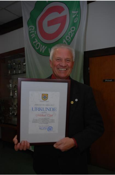
Gülzower des Jahres 2011