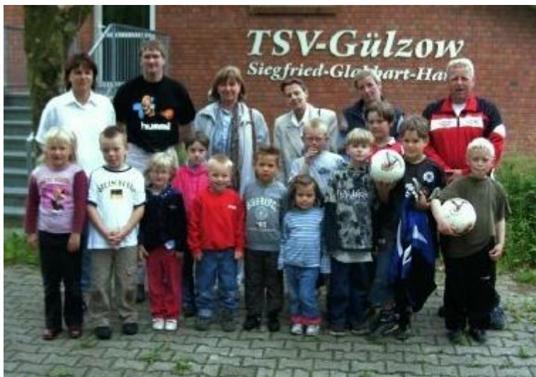
Trainer und Obmann der Fußballjugend Gülzow, Kindergärtnerinnen der Kindergartens Gülzow, Kinder der G- und F-Jugend des TSV Gülzow.

Aufgrund der tollen Unterstützung der doch sehr zahlreichen Sponsoren konnte die Jugendfußballabteilung des TSV Gülzow auf dem Vatertagsturnier eine große Tombola präsentieren. Ein Teil dieses Erlös wurde nun dem Kindergarten Gülzow gestiftet, der damit Spielgeräte zur Erweiterung des Spielplatzes anschaffen kann. Ebenso möchten wir uns auf diesem Wege nochmals recht herzlich bei allen Sponsoren und Helfern für die große Unterstützung bedanken, denn ohne sie wäre dies alles nicht möglich!