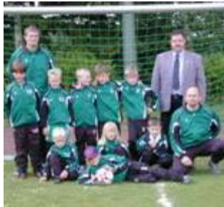
Firma Haus- und Hof