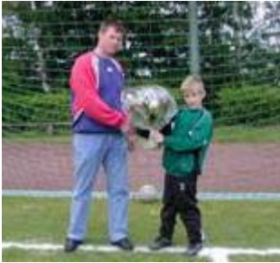
Thomas Meyer Autoservice